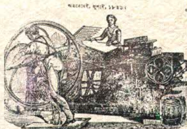
চাপা খানাৰ বিবৰণ ।

তবে সভে ওচি বহা নিবাবন কৈন । অভিমানে সোমদত্ত দেশেরে চলিল ॥